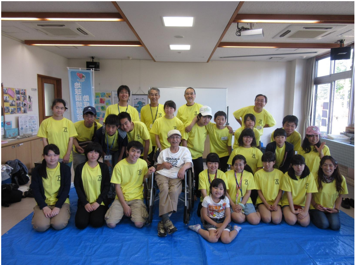
「第1回ユースラムサール交流会 in 藤前干潟」開催

「ユースラムサールジャパン (Youth Ramsar Japan)」は、全国のラムサール条約登録湿地で活動する中学生～大学生の「ユース世代」によるネットワーク・グループです。